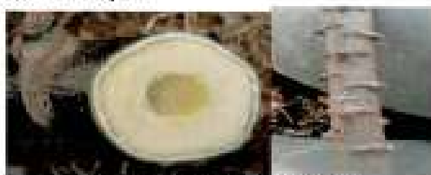
Estacas sanas y maduras

Condición de estacas para su plantación: maduras y sanas, con mayor diámetro de tallo que de médula. Rama sana y bien hidratada de la que fluye látex al raspar