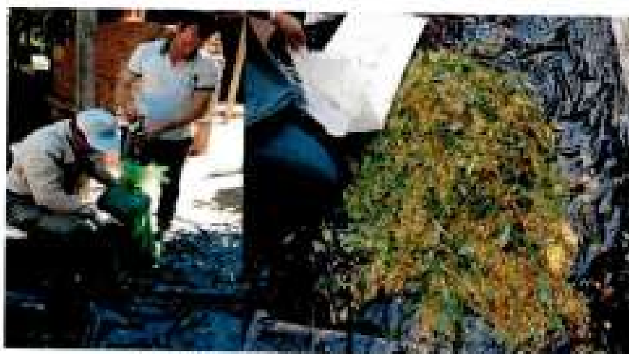
Picado y confección de microsilos

Las hojas de mandioca y la caña o maíz se pican en trocitos de 1 a 2 cm, el material será colocado en bolsas plásticas de 2 micrones y será compactado para eliminar el oxígeno. Una vez compactado el forraje las bolsas se cierran herméticamente y se las guarda con mucho cuidado teniendo en cuenta que las bolsas no deben romperse durante todo el periodo de conservación.