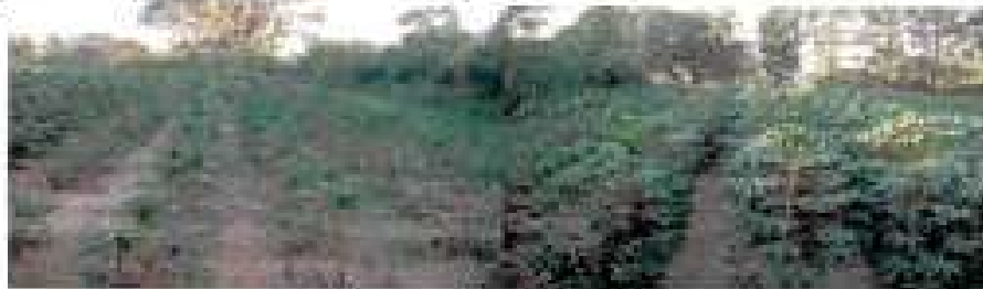
Marco de plantación

Marco de plantación más flexible: 1 x 1 m. Opciones: 1 x 0.8m; 1 x 0.5 m (según el porte del cultivar).