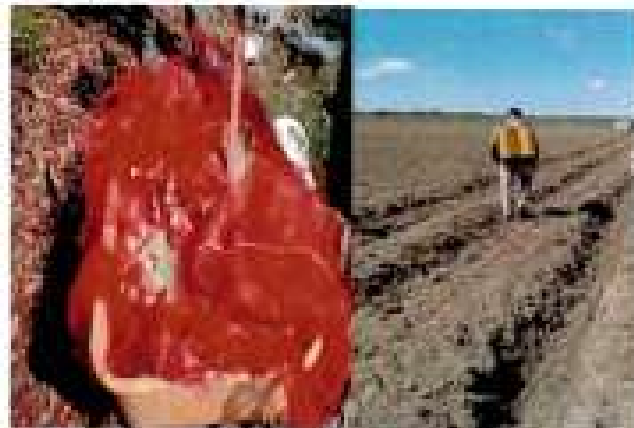
Desinfección de estacas

Tratamiento de estacas antes de su plantación: 20 cc de Imidacloprid+ 30 g de Mancozeb + 30 g de Oxiclورو de cobre por cada 10 litros de agua. Pulverizar en el surco o hacer baño de inmersión previo a la plantación.