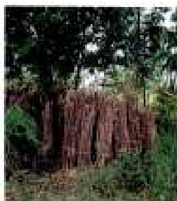
Conservación de estacas

Época de plantación recomendada para la zona NEA: 15 de septiembre al 15 de octubre.