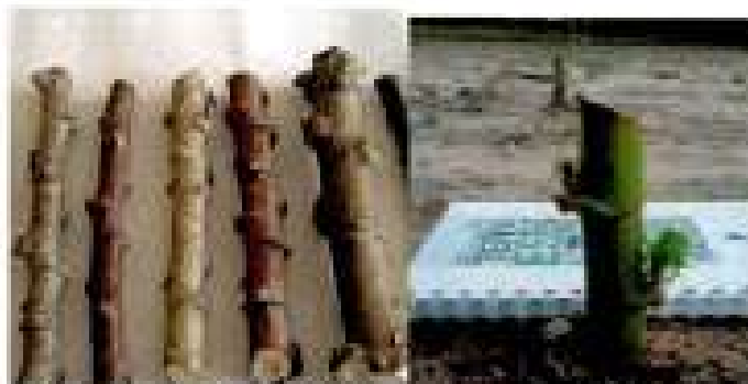
Plantación de estacas horizontal y vertical

Posición de plantación y tamaño de estacas: horizontal con estacas de 10 cm de longitud; vertical con estacas de 20 cm de longitud (50% enterrada).