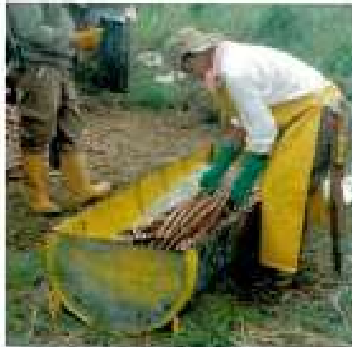
Desinfección de ramas para su conservación

Tratamiento de estacas antes de su plantación: 20 cc de Imidacloprid+ 30 g de Mancozeb + 30 g de Oxiclورو de cobre por cada 10 litros de agua. Pulverizar en el surco o hacer baño de inmersión previo a la plantación.